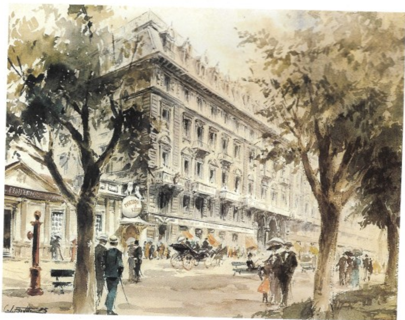
Palazzo della Martini & Rossi sul Corso Vittorio Emanuele II in Torino.