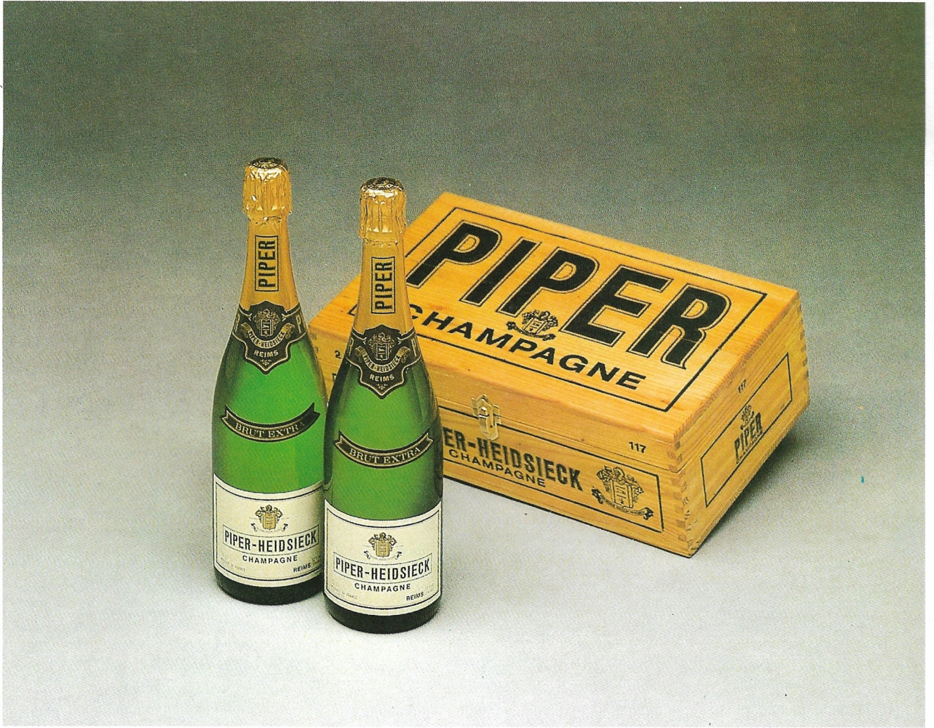
2 Champagne Piper Brut